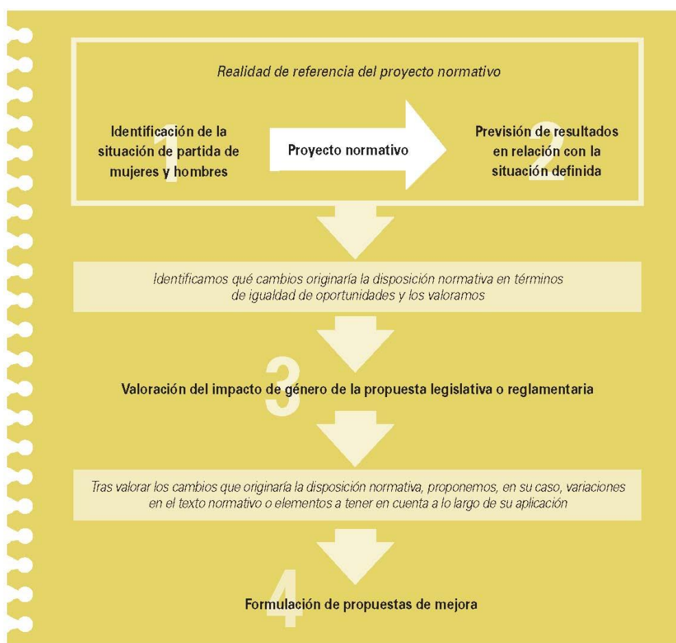
FIGURA 2. PASOS A SEGUIR EN LA REALIZACIÓN DE UN ANÁLISI DE IMPACTO DE GÉNERO.