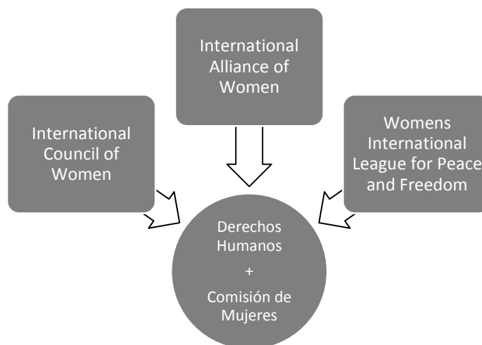
FIGURA 1. FEMINISMO INTERNACIONAL ORGANIZADO EN EUROPA Y ESTADOS UNIDOS

se establecieron como foros que luchaban por mejorar la posición de las mujeres en la sociedad y contribuyeron fuertemente al desarrollo del feminismo internacional. De las tres organizaciones la más radical fue la Liga aun cuando la defensa absoluta del pacifismo, la necesidad de transformaciones sociales revolucionarias y la resistencia frente al imperialismo siempre fueron temas controvertidos en los que nunca se logró llegar a un consenso pleno. A través de las intervenciones de estas organizaciones en la Liga de las Naciones y la Organización Internacional del Trabajo (ILO) lograron colocar las demandas de las mujeres en la agenda internacional (Miller, 1994).