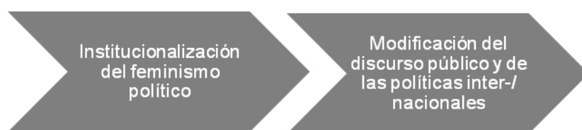
FIGURA 2. CONSECUENCIAS DE LA INSTITUCIONALIZACIÓN DEL FEMINISMO POLÍTICO