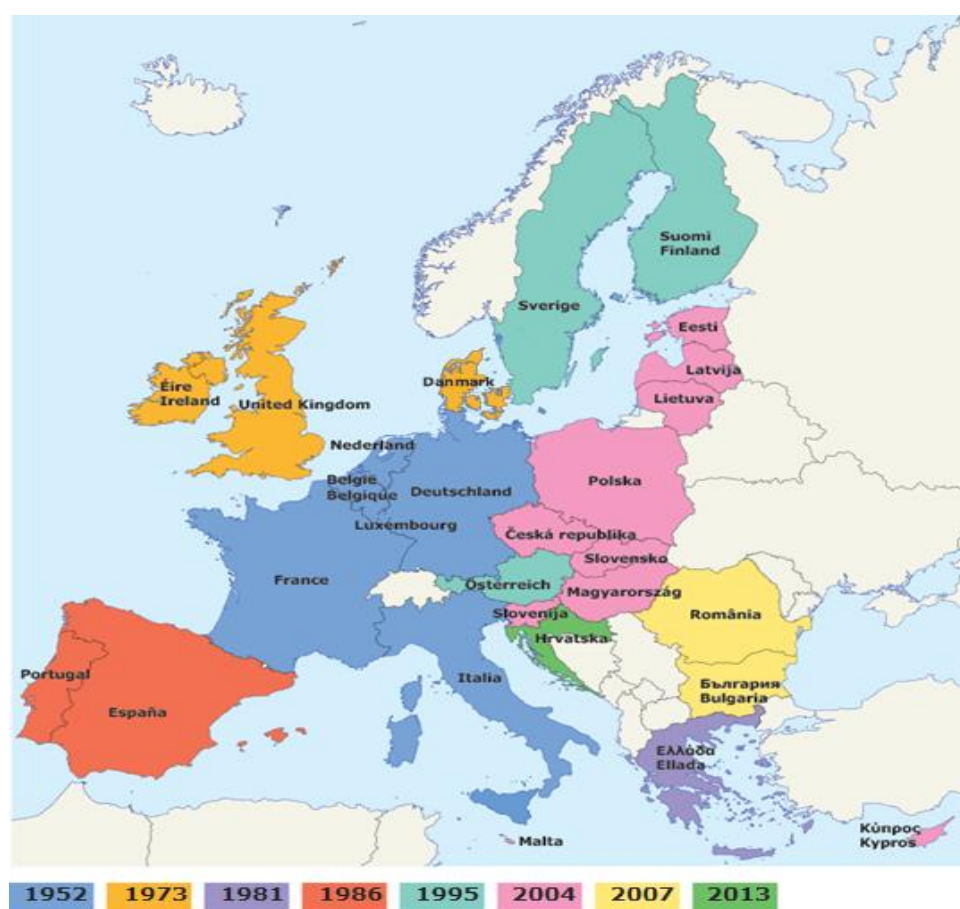
FIGURA 4. PROCESO DE AMPLIACIÓN DE LA UE: DE 6 A 28 ESTADOS MIEMBROS