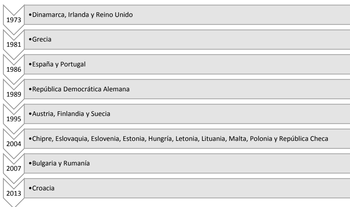
FIGURA 3. PROCESO DE AMPLIACIÓN: CRONOLOGÍA DE LOS PAÍSES QUE SE HAN ADHERIDO A LA UE DESDE SU CREACIÓN

El proceso de ampliación se inició en 1973 con la entrada de Reino Unido, Irlanda y Dinamarca, más de veinte años después de la creación de la CECA. La adhesión de nuevos miembros ha generado siempre tensiones en el sí de la UE, pues los intereses políticos y económicos de los diferentes países y los desequilibrios que se podían generar en el funcionamiento institucional y organizativo de la UE llevaban a cabo unas duras negociaciones entre los países candidatos y los estados miembros.