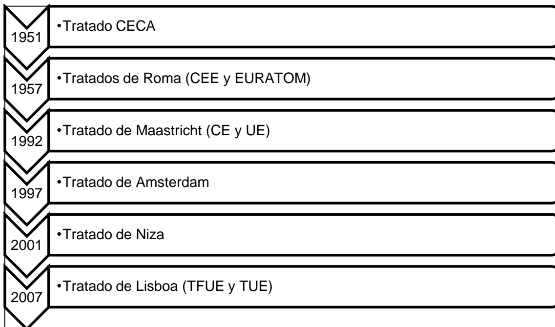
FIGURA 5. PRINCIPALES REFORMAS DE LOS TRATADOS CONSTITUTIVOS DE LA UE