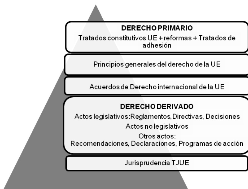
FIGURA 1. SISTEMA DE FUENTES DEL DERECHO DE LA UE

El sistema de fuentes del ordenamiento jurídico de la UE puede resumirse en el siguiente cuadro.