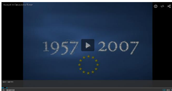
FIGURA 2. VÍDEO. LA HISTORIA DE LA UE EN IMÁGENES

Como una imagen vale más que mil palabras haz clic en la imagen para visualizar la historia de la UE y reflexionar sobre su origen y evolución. Reta tu mente a detectar cinco políticas que los estados miembros comparten.