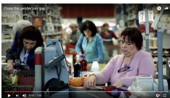
FIGURA 3. VÍDEO. CLOSE THE GENDER PAY GAP

Haz clic en el vídeo Close the gender pay gap para entender a través de la cesta de la compra los efectos de la brecha salarial.